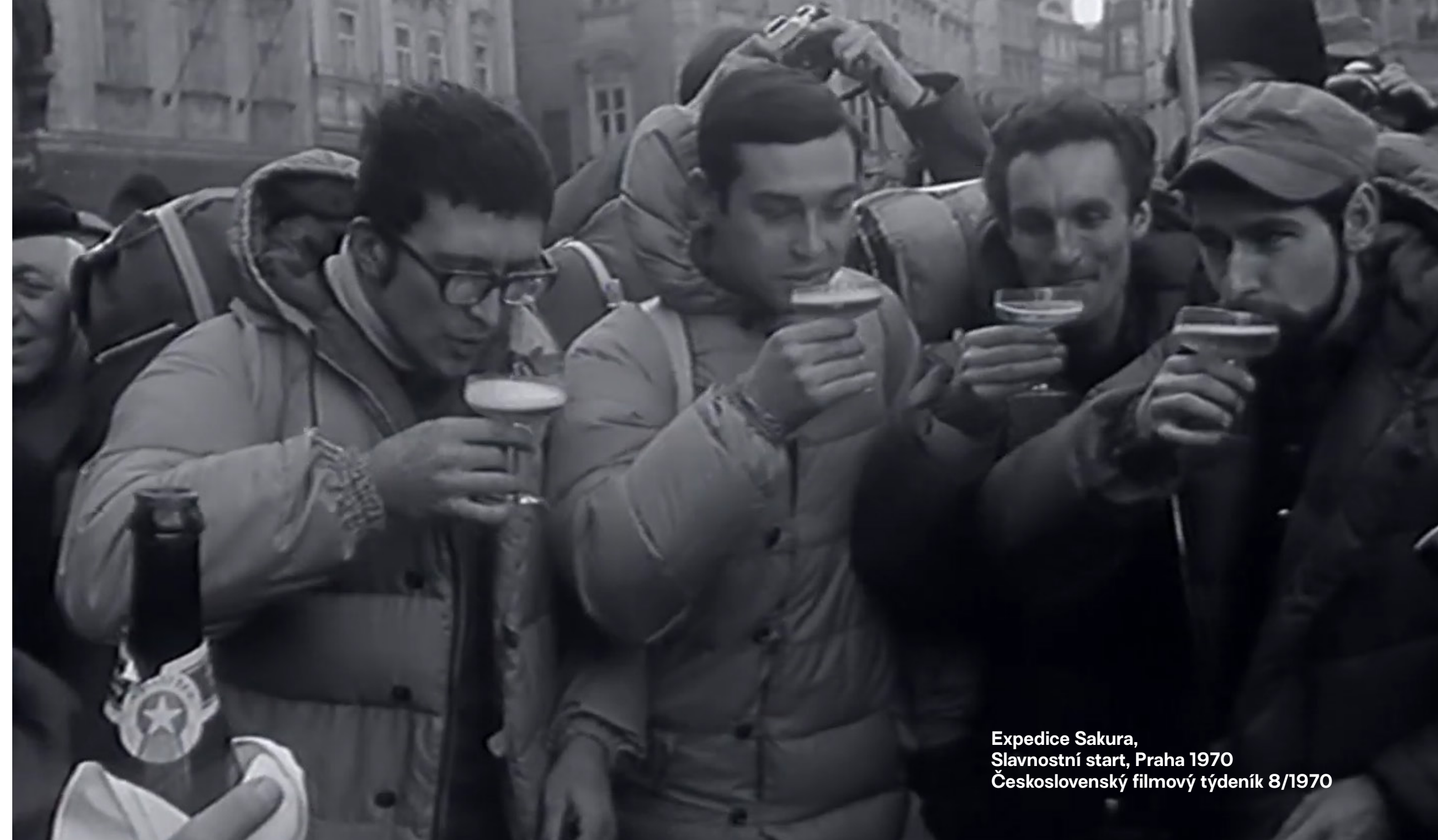
Expedice Sakura, Slavnostní start, Praha 1970 Československý filmový týdeník 8/1970

Cesta může být stejně důležitá jako cíl. Pojďme společně psát tento příběh.