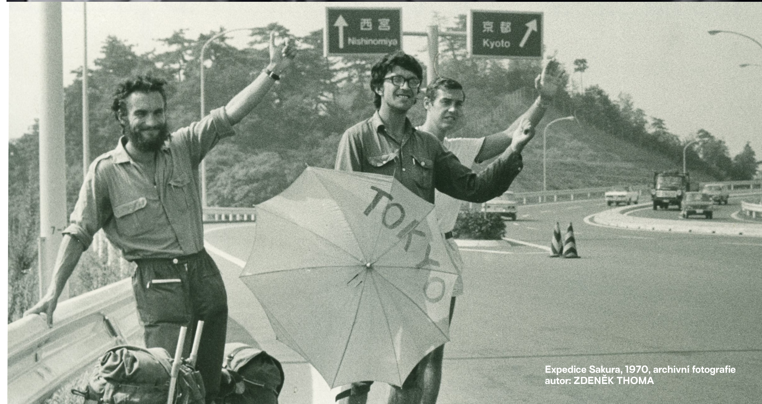
Expedice Sakura, 1970, archivní fotografie