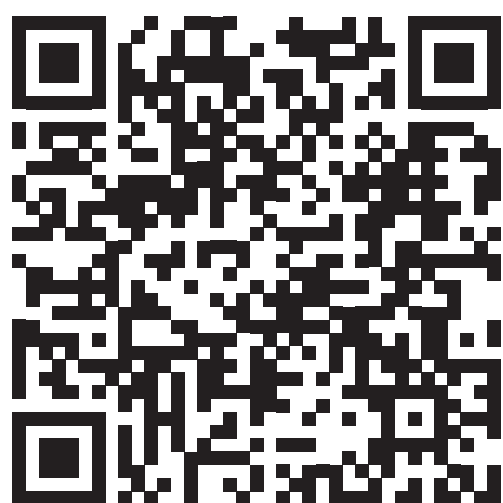
ČESKÁ TELEVIZE Události